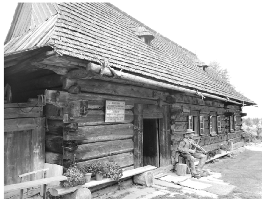
Tradycyjna chata podhalańska