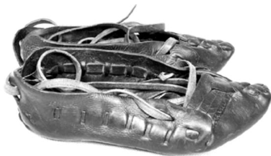
Kierpce z Podhala, początek XIX wieku